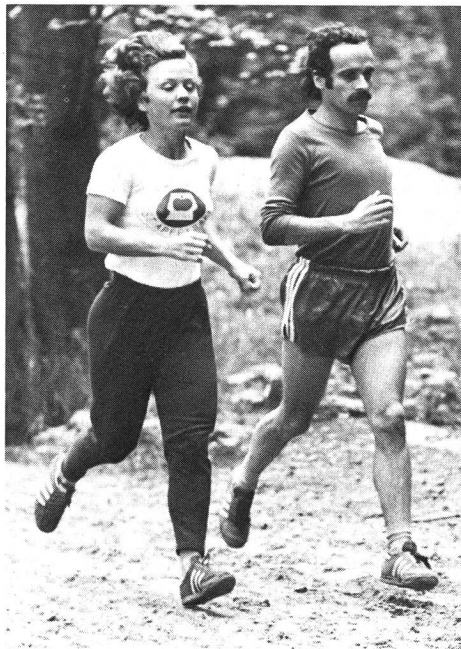
Train de mesures 2

A notre avis, on devrait accorder une priorité absolue à la réalisation de ce premier « train de mesures » et, pour ce faire, choisir trois ou quatre fédérations/sociétés sportives. Choix limité, donc, mais suffisant pour mener à bien la phase d'essai.