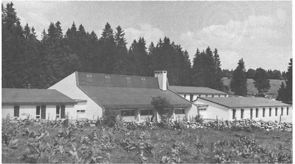
Le centre sportif des Cernets-Verrières.

Selon les statistiques de l'année 1981, les moniteurs J + S du canton de Neuchâtel ont organisé 386 cours et ils ont dispensé leur enseignement à 8710 participants (2946 filles et 5764 garçons). Il est pourtant difficile de tirer des conclusions, car cette année inaugurerait l'ère de la nouvelle conception J + S. Nous pouvons tout de même constater qu'il y a eu une diminution des camps scolaires (passagère peut-être) compensée par une augmentation des groupements sportifs, en particulier ceux de basketball, de volleyball et, surtout, de judo et de tennis. Il faut espérer que cette dernière tendance se poursuive et que la