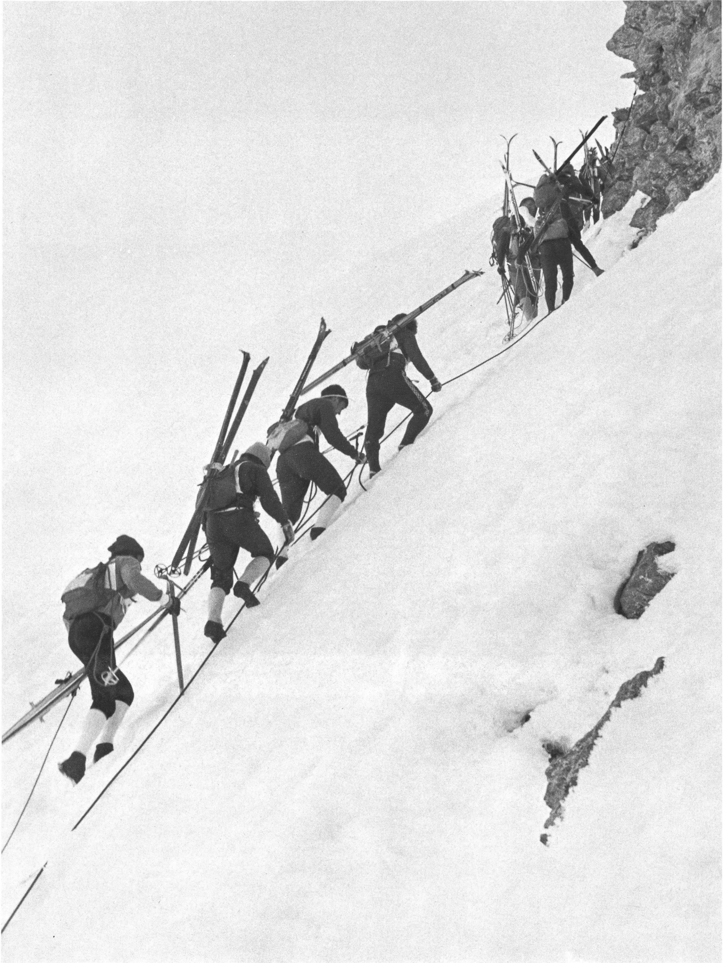
Le 18 avril dernier, le 35e Trophée du Muveran a été un nouveau sujet de fascination.