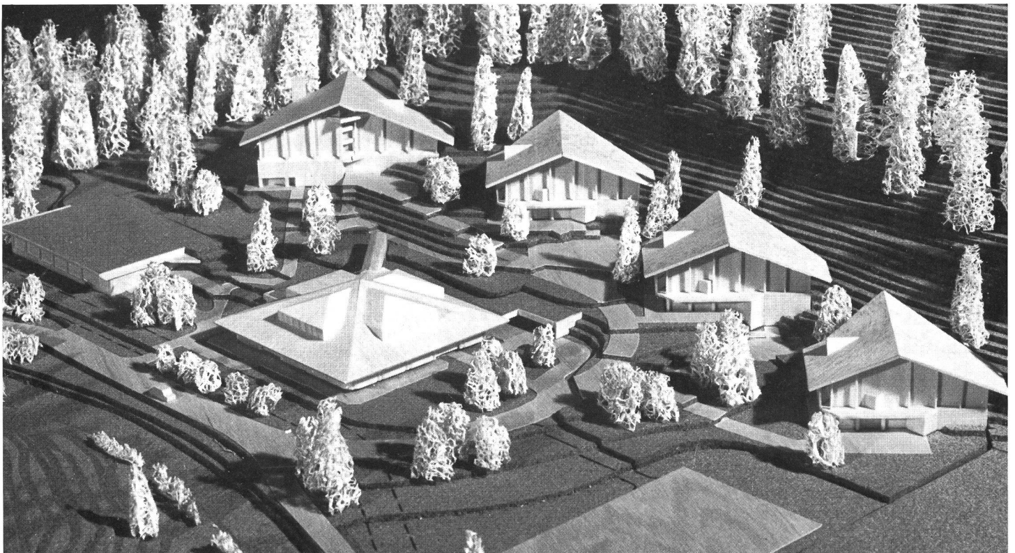
Centre de cours (ski) de l'EFGS, à la Lenk

Ce changement est d'une importance capitale. Il laisse espérer que le sport pourra être mieux intégré dans notre société et qu'il deviendra un élément réel de notre culture malgré les dangers qui l'entourent. Le sport donne à chacun sa chance. Pour une fois, c'est lui qui en a besoin. ■