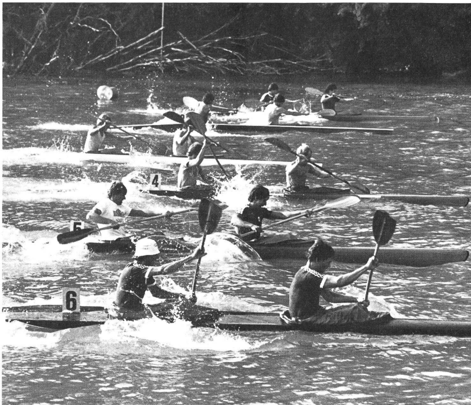
Départ des kayaks biplaces.

Le plan d'eau idéal pour la compétition (par exemple le Rootsee en Suisse) permet 9 pistes de 9 m de largeur. Il ne présente pas de courant et un minimum de vagues. Il devrait avoir une profondeur d'au moins 3 m et être particulièrement protégé contre les vents latéraux. Le programme de compétition comprend des courses, dans les catégories K1, K2 et K4, sur 500 m pour dames et messieurs, et sur 1000 m pour messieurs, à parcourir en ligne droite. En plus, une course de fond sur 10000 m a lieu, pour les hommes, sur un circuit composé de lignes droites de 1000 à 2500 m. Comme dans les compétitions d'aviron, la fascination se trouve dans la lutte d'homme à homme, bateau contre bateau. Chaque équipage essaie, par un nombre de coups de pagaie très élevé (parfois plus de 120 coups à la minute), de prendre dès le départ une position favorable. Lors des courses de 500 et de 1000 m, les embarcations doivent rester dans leur piste; dans les courses de fond, la «prise de la vague» d'un autre concurrent (sorte de surfing) constitue un important moyen tactique. Ici aussi, il est interdit de gêner les autres compétiteurs.