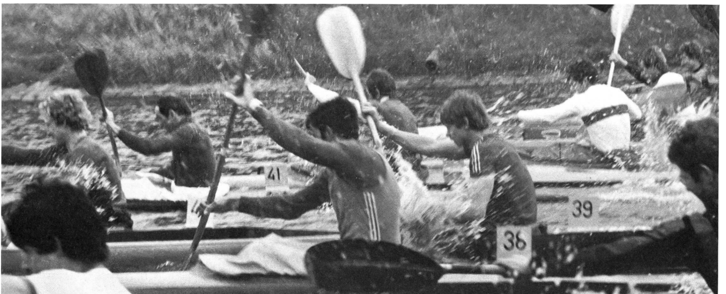
Course spectaculaire en kayak à quatre: 1000 m sont parcourus en moins de 3 min. 30 au rythme de 120 coups de pagaie.

200 compétiteurs, venant de 10 pays différents, y participent régulièrement. Malheureusement, même les lacs ne sont plus accessibles librement, ce qui signifie qu'un entraînement régulier n'est plus guère possible que dans un club de canoë qui possède son «garage» au bord de l'eau. Les sociétés spécialisées acceptent à bras ouverts les filles et garçons qui s'intéressent à ce sport. Seule condition préalable: Il faut bien savoir nager. La régates est une branche sportive indépendante à l'intérieur de la branche J+S canoë-kayak. Les clubs tiennent à disposition d'excellents moniteurs formés par J+S. ■