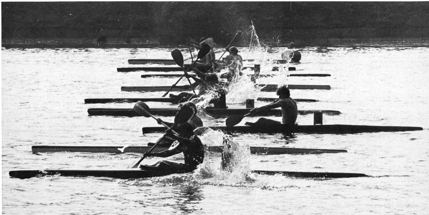
Départ des kayaks monoplaces.