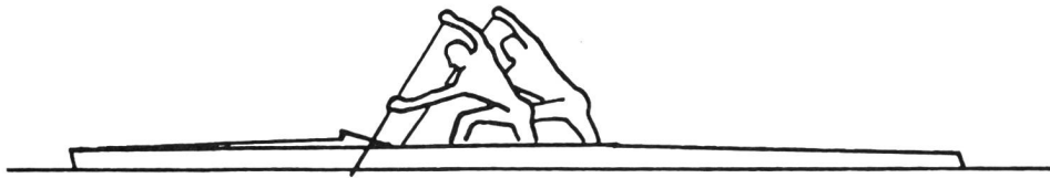
Canadien de course en eau calme