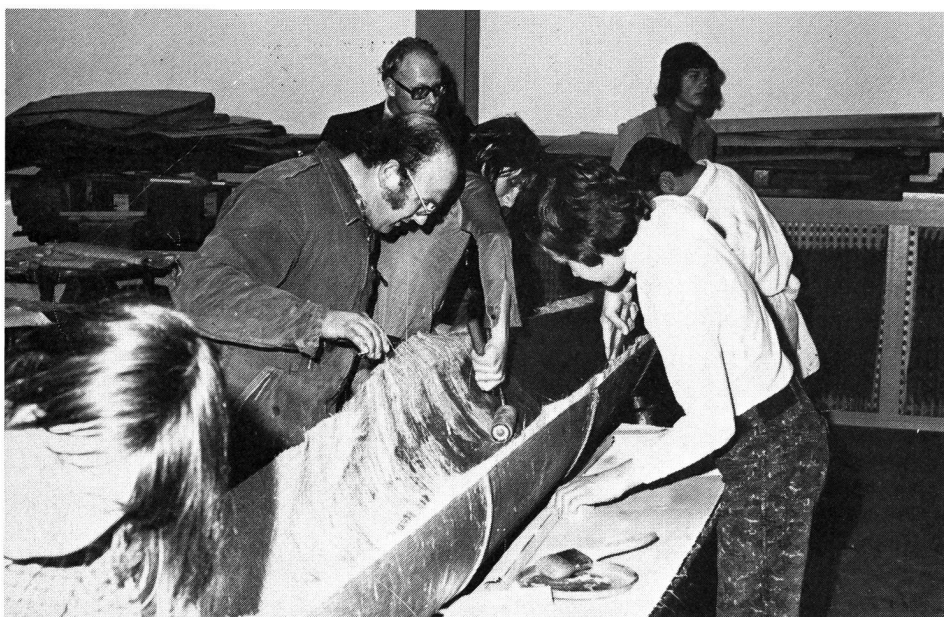
Même les kayaks de régates peuvent être fabriqués par soi-même. Voici, pour exemple, un cours de branche sportive de l'école secondaire de Rapperswil.

En Suisse, les régates ne se disputent pratiquement qu'en kayak 1 . C'est surtout dans les pays de l'Est, où le sport de régates en canoë est beaucoup plus répandu, que l'on utilise également des canoës-canadiens 2 . Il existe des kayaks à une (K1), à deux (K2) ou à quatre places (K4). Ils doivent correspondre exactement aux prescriptions internationales quant à leur longueur, à leur largeur et à leur poids.