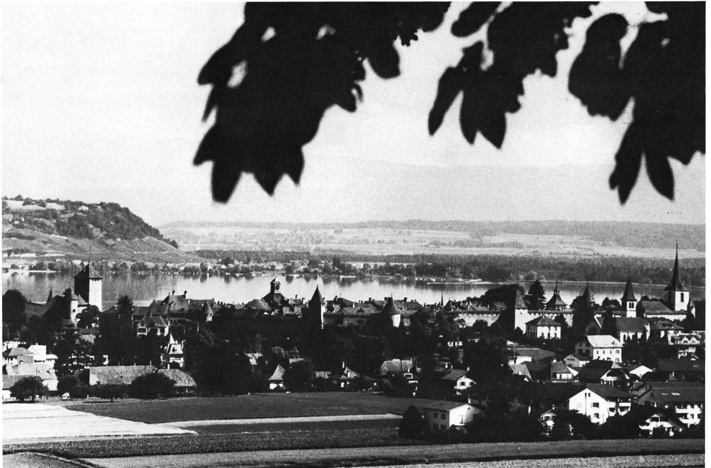
Le charme de Morat, d'où sont partis 15 000 coureurs le 2 octobre 1983.