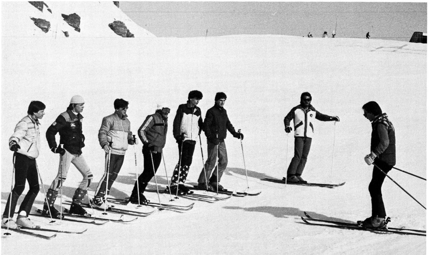
La théorie avant la pratique.

En fait, lors de telles réunions de formation, les enseignants doivent s'efforcer d'apporter – et les candidats moniteurs de recevoir – les éléments fondamentaux, d'ordre aussi bien socio-pédagogique que pratique, qui correspondent à ceux prônés par la « Conception Jeunesse + Sport » et qui sont, pour les premiers, de ne pas oublier qu'ils ont à préparer des meneurs d'hommes (les seconds) capables non seulement d'encadrer, mais d'animer, d'enthousiasmer une jeunesse qui, à l'âge qu'elle a, n'attend qu'un signe de motivation suffisamment convaincant pour se laisser entraîner dans le sillage d'un chef de file. « Le dynamisme de J + S dépend de l'esprit et des qualités de ses moniteurs. » Or, les qualités se cultivent pour mieux éclore et l'esprit s'acquiert et se développe pour mieux se répandre. ■