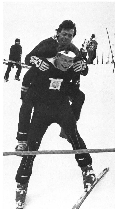
Force, équilibre, jeu!

Etre moniteur 3 c'est bien! Etre un moniteur 3 actif, c'est mieux!