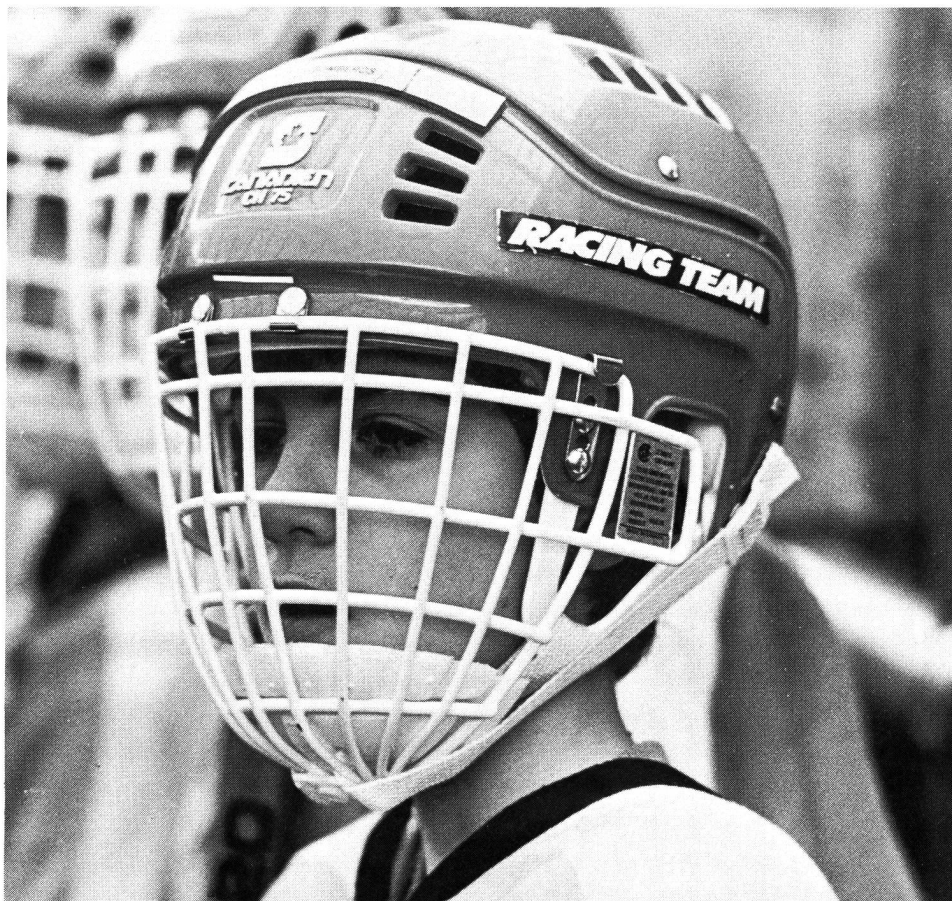
Ton avenir? La santé par le sport!

Comme je suis en pleine compétition, le sport est devenu mon travail quotidien. Afin d'être dans une forme optimale, je passe beaucoup de mon temps à m'entraîner. Deux fois par jour, je suis dans le « bain ». Il est impossible qu'un athlète d'élite ne pense pas chaque jour à sa préparation, et ceci sous toutes ses formes, sans sacrifier pour autant son travail professionnel. Je mène de front ma vie quotidienne avec ma vie sportive. Cela me convient parfaitement. Il est vrai qu'il y a un