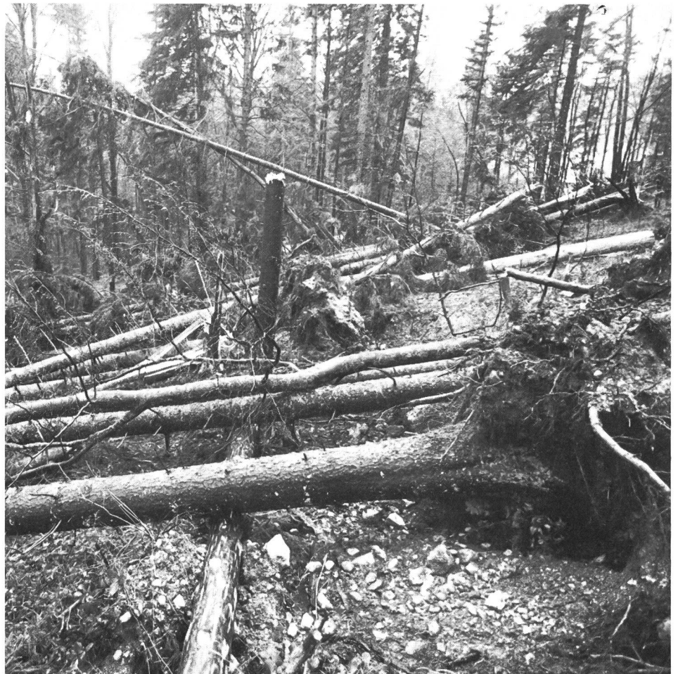
Tout près de l'Institut de recherches.