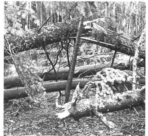
Non loin de la piscine.

Le dernier week-end de novembre, la tempête a déferlé sur le pays, semant la désolation et la tristesse en bien des endroits. Les magnifiques forêts de Macolin n'ont pas été épargnées. Des centaines d'arbres – des sapins surtout – gisent entremêlés sur le sol: ceux-ci cassés comme des allumettes à mi-hauteur, d'autres déracinés. Il faudra longtemps pour tout débarrasser et même, lorsque ce sera fait, d'énormes plaies resteront ouvertes. Heureusement, aucun bâtiment n'a été touché. La piste finlandaise, par contre, est totalement obstruée et inutilisable jusqu'au printemps au moins. (Y.J.) ■