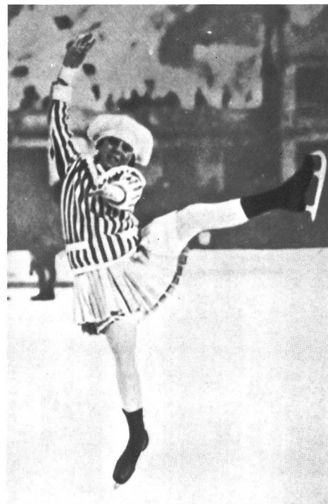
Sonja Henie, petite fée de la glace.

«Le Comité international olympique institue un cycle distinct de Jeux olympiques d'hiver. Ces Jeux auront lieu la même année que les Jeux olympiques. Ils prendront le nom de premiers, deuxièmes, troisièmes Jeux olympiques d'hiver et seront soumis à toutes les règles du protocole olympique. Les prix, médailles, diplômes et documents devront être différents de ceux employés pour les Jeux de l'olympiade en cours (le terme olympiade ne sera pas employé). Le Comité international olympique désignera la localité où seront célébrés les Jeux olympiques d'hiver, et réservera la priorité au pays détenteur des Jeux de l'olympiade à la condition que ce dernier puisse fournir les garanties suffisantes de sa capacité d'organiser les Jeux d'hiver dans leur ensemble.»