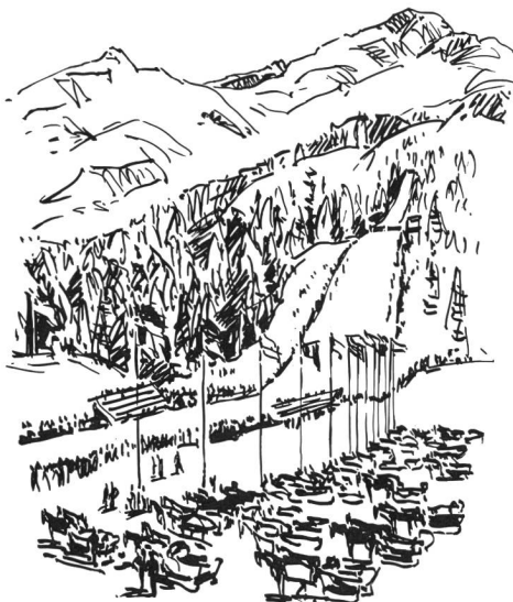
St-Moritz: parc à traîneaux.

Parmi les 494 concurrents et concurrentes de 25 pays, qui s'étaient déplacés dans l'Engadine, les plus touchés par les caprices du ciel furent sans aucun doute les