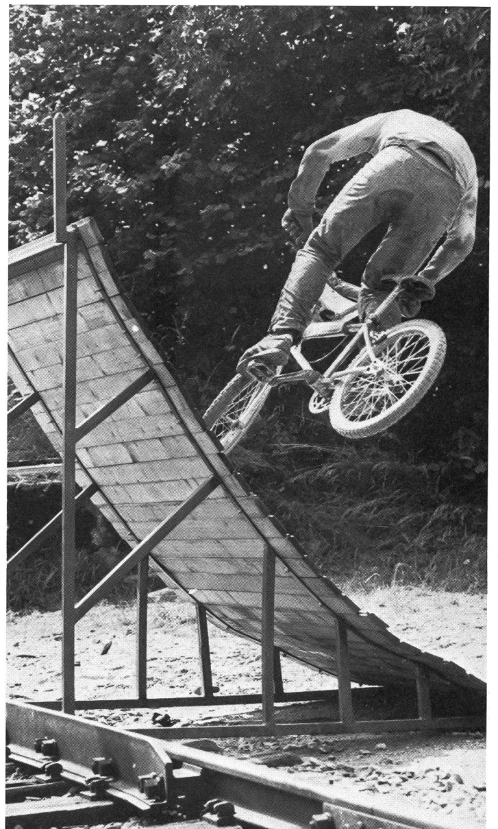
Monter une rampe de bois et effectuer un virage de 180° en l'air!