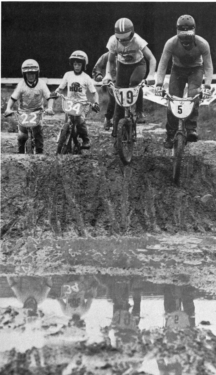
Sur le parcours accidenté, il faut allier force et technique.