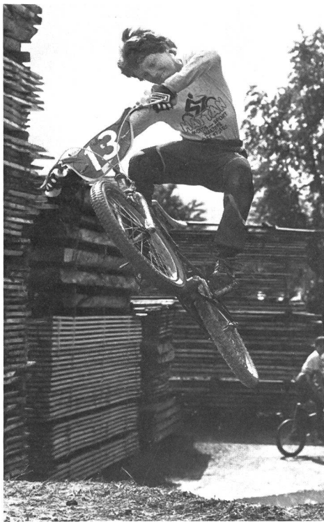
Un jeune «acrobate» à l'œuvre! But: maintenir sa monture dans la direction de la piste.