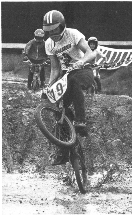
Force musculaire et capacités techniques sont décisives sur ces pistes mouvementées.