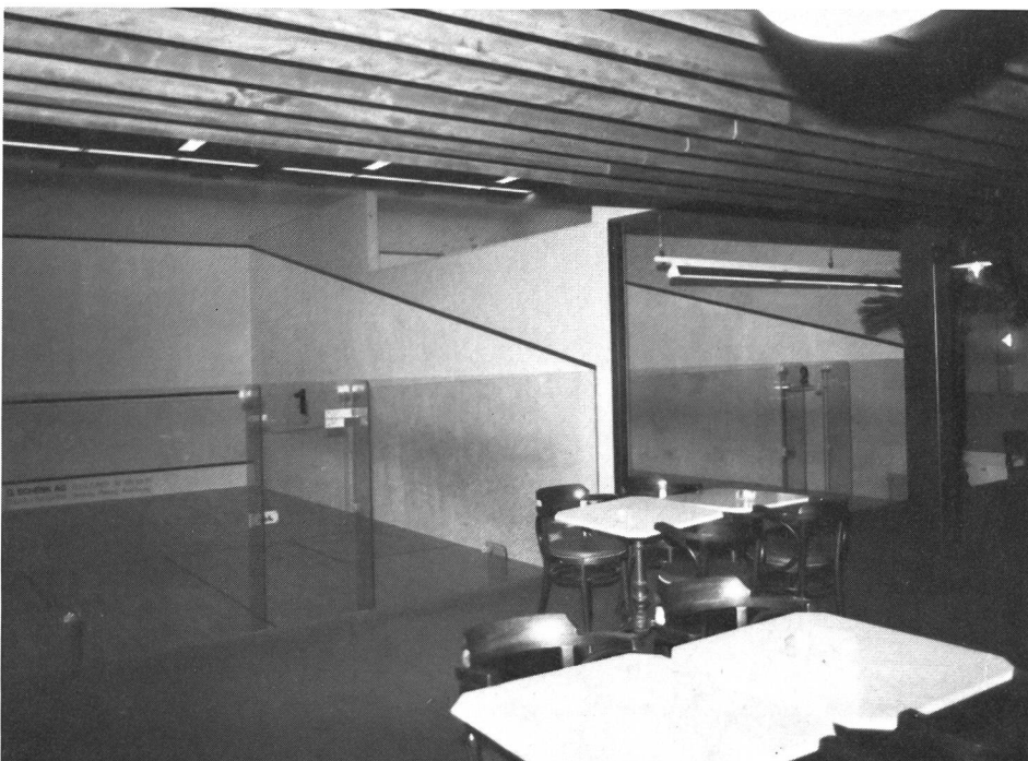
...et de se désaltérer si besoin est!

Secrétariat de l'ASSR Case postale 162 4132 Pratteln Tél. 061 81 38 18 ■