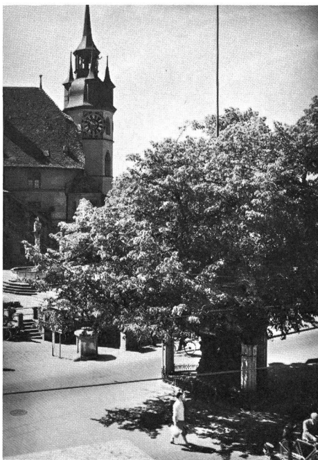
Le tilleul de Morat, symbole de liberté.

C'est le sort de l'Europe qui s'est joué aux époques concernées, aussi bien en Grèce qu'en Suisse: à Marathon d'abord (12 septembre 490 avant Jésus-Christ), alors que le Continent était menacé pour la première fois par une tentative sérieuse d'assujettissement par l'Orient, à Morat ensuite (22 juin 1476), la même menace venant cette fois d'Occident. En outre, ces deux victoires ont contribué à insuffler à l'Europe la notion de nation et d'indépendance, liée à un sens profond de l'héroïsme et de la démocratie.