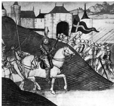
Adrien de Bubenberg et ses Confédérés arrivent à Morat.

Deux princes de luxe donc, face à deux petites nations d'acier, fières de leur indépendance et d'une entité forgée durement au fil des ans; deux situations, comme je l'ai déjà dit, presque identiques dans leur devenir, dans leur développement et dans leur conclusion, ce qui a fait dire à Byron (1788–1824), le célèbre poète romantique anglais: «Morat et Marathon, vos noms sont unis à jamais». Les batailles décisives