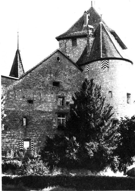
Le château de Morat.

Les raisons socio-économiques et hygiéniques du développement massif de la course à pied, en tant que simple exercice physique d'appoint d'abord, puis en tant que sport sont maintenant bien connues. Mais il est d'autres motivations: militaires, patriotiques et affectives, qui ont contribué à ancrer son caractère traditionnel et à assimiler sa pratique à un acte rituel empreint d'un esprit positivement mystico-sentimental et lié, par une multitude d'objets symboliques, au rappel d'importants événements du passé. Ceux-ci sont d'ailleurs presque toujours transformés en légendes par le temps. Les exemples de ces réunions mi-commémoratives, mi-sportives sont nombreux. Je n'en retiendrai que deux, particulièrement représentatives et qui ont, dans leurs origines, leur développement et leur aboutissement, de telles similitudes qu'on a presque peine à croire qu'elles concernent deux époques et deux pays fort éloignés: le marathon, issu de la bataille de Marathon entre les Grecs et les Perses; Morat–Fribourg, issu de la bataille de Morat entre les Suisses et les Bourguignons. La Grèce et la Suisse, deux petits pays luttant de la même façon contre un même genre d'opresseurs et pour la conquête des mêmes libertés fondamentales.