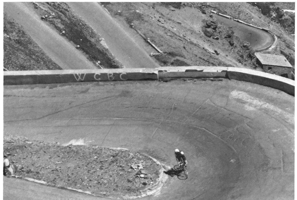
Juillet 1984: la haute montagne «comme avant».

Pour terminer, je remercie toutes les personnes qui, par leur parfait travail, leur compétence et/ou leur soutien, m'ont permis de garder un excellent moral tout au long de mon aventure et de me remettre rapidement en selle, bref, de revivre: mon chirurgien et son équipe, le personnel soignant, mes amis et ma famille. ■