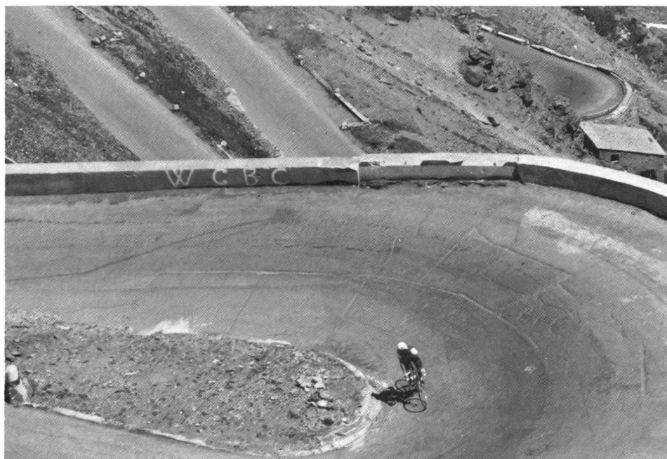
Juillet 1984: la haute montagne «comme avant».

Pour terminer, je remercie toutes les personnes qui, par leur parfait travail, leur compétence et/ou leur soutien, m'ont permis de garder un excellent moral tout au long de mon aventure et de me remettre rapidement en selle, bref, de revivre: mon chirurgien et son équipe, le personnel soignant, mes amis et ma famille. ■