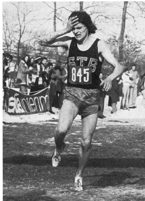
Ryffel: l'apprentissage de la souffrance.

Dames: 1. Waitz (Norvège) 16'19" – 5. Bürki (0'54") – 51. Moser (2'01") – 62. Liebi (2'17") – 75. Bendler (2'42")