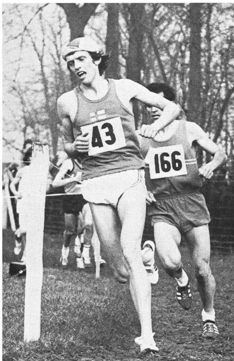
Paivärinta (Finlande), premier champion du monde de cross-country (Waregem, 1973), ici devant Haro.

Par la suite se décida la création de l'ICCU (International Cross-country Union), qui réunissait l'Angleterre, l'Ecosse, le Pays de Galles et l'Irlande, d'où la naissance d'un Cross des cinq Nations dès 1903. En 1923 l'entrée de la Belgique en fit le Cross des six Nations puis, de plus en plus de pays entrant en scène, on finit par l'appeler tout simplement le Cross des Nations ou l'International de cross-country. Au début des années septante, l'ICCU, marginale à la Fédération internationale d'athlétisme, fut dissoute et cette dernière (l'IAAF) prit définitivement les destinées du cross-country en mains créant, dès 1973, un officiel Championnat du Monde! Il comprend une catégorie élite hommes (12 km), une catégorie élite dames (4 km 500) et une catégorie juniors (7 km 500). Il se dispute toujours dans la deuxième partie du mois de mars.