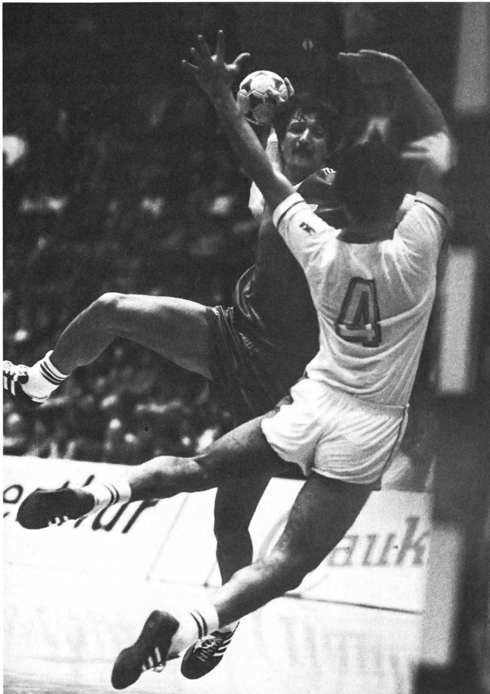
Hongrie – Algérie.