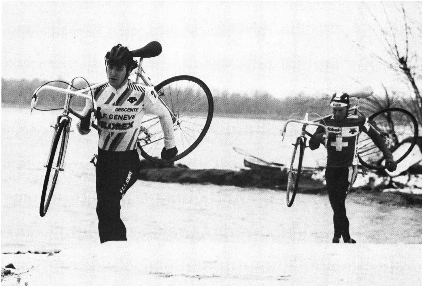
... et dans l'ordre inverse.

Depuis quelques années, les courses au titre ne se disputent plus sur une distance donnée, mais sur un certain laps de temps plus un tour. Raison de cette modification: suivant les conditions de terrain, le temps de course pour une même distance peut passer du simple au double. La nouvelle réglementation est cependant peu satisfaisante, les derniers Championnats du monde l'ont démontré.