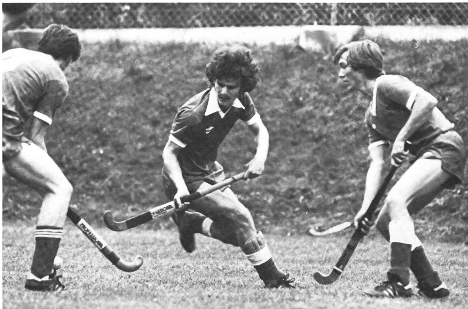
Hockey sur terre: petite branche deviendra grande?