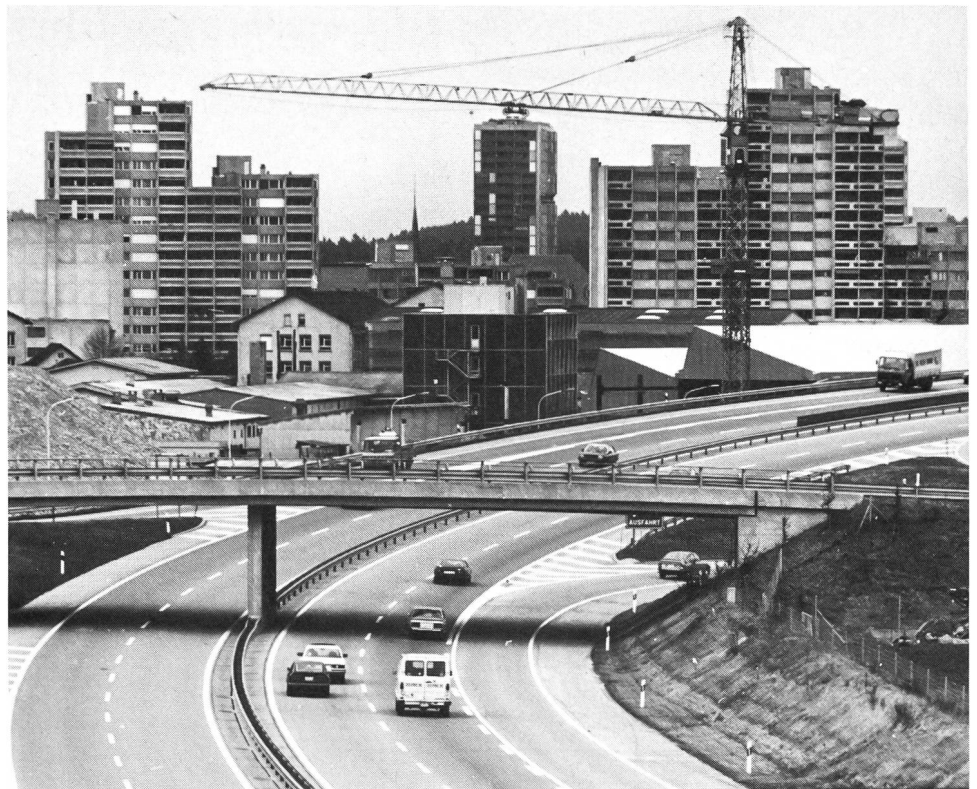
Béton total! Préserver le paysage? Pas si facile!...

Sur le plan de la réalisation, l'aménagement du territoire est en pleine crise. Les délais impartis par la loi fédérale pour l'élaboration des plans directeurs cantonaux (1er janvier 1985) et pour la réorientation des plans d'affectation (1er janvier 1988) n'ont pas été et ne seront pas respectés. C'est aux autorités que s'adressent avant tout les reproches de défaillance: elles n'ont pas tout mis en œuvre pour réaliser