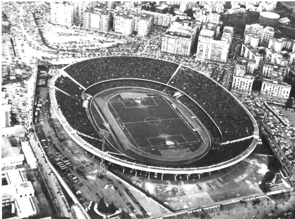
Le stade San Paolo en pleine ville de Naples: harmonie difficile.

gement d'attitude à cet égard. Le sport de demain accusera une hausse encore plus marquée du phénomène de masse, tout en développant de nouvelles formules dans le domaine du jeu et de la compétition.