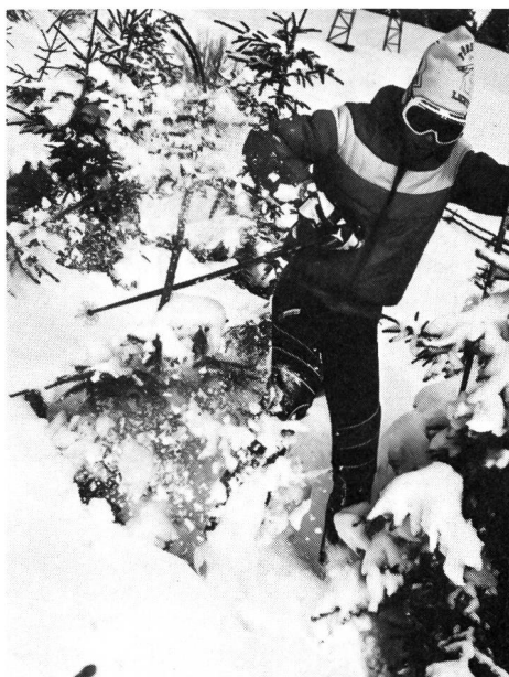
Faudra-t-il en arriver à mettre des barrières partout?

La planification et l'aménagement de l'environnement devraient déterminer de façon décisive les formes d'action réalisables, encourageant certaines idées tout en écartant d'autres. En conséquence, la conception des installations sportives devrait tenir compte des besoins de toutes les couches de la population, ainsi que des différentes fonctions inhérentes ou attribuées au sport.