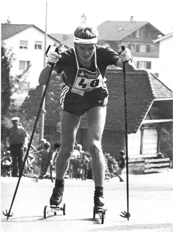
En attendant le retour de la Fée blanche.