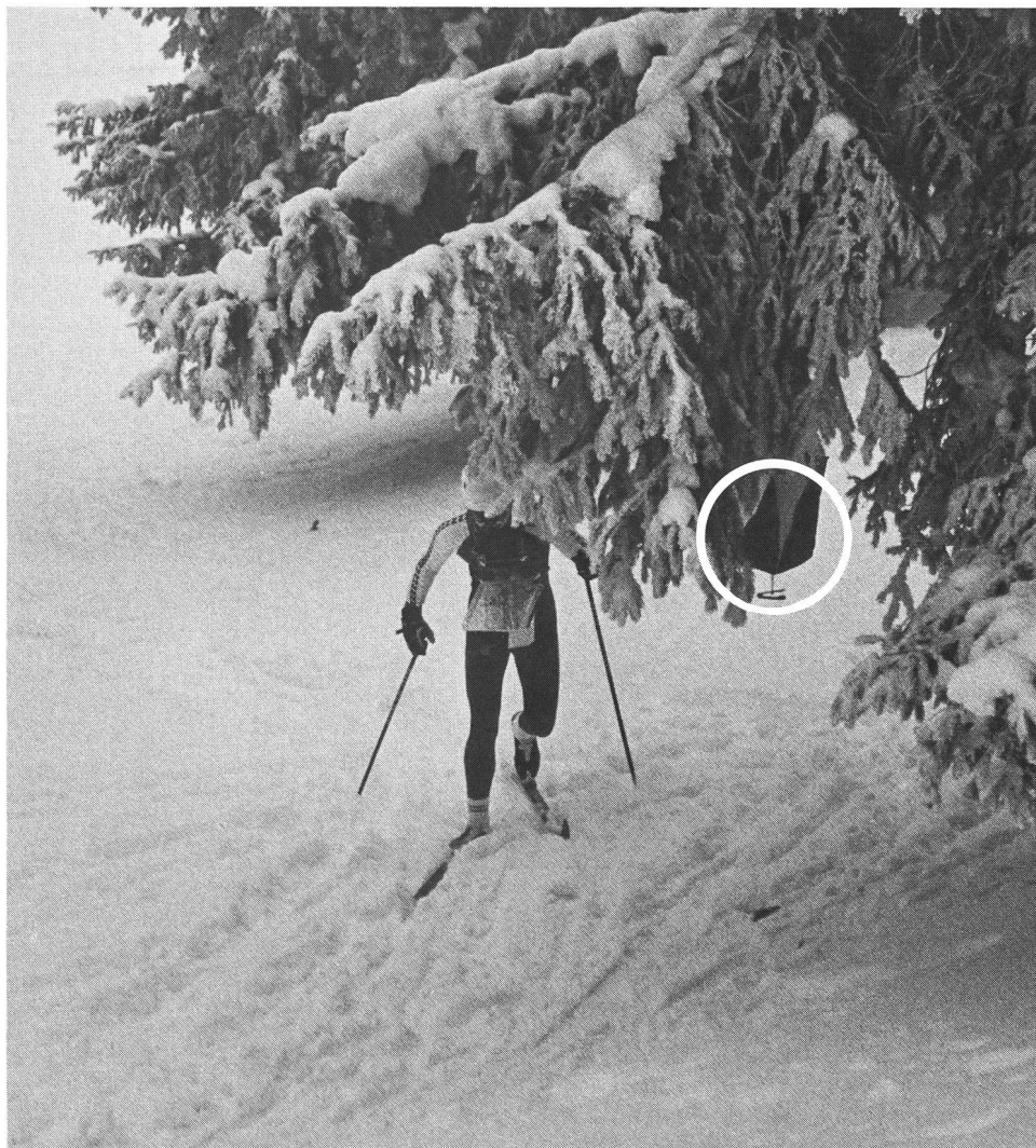
Pour trouver ce poste-ci, il faut lever les yeux.