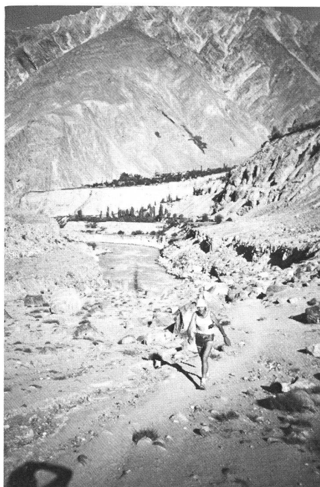
Seul, face à l'immensité.

... et merci plus particulièrement pour les pages 1 à 3 du dernier numéro (10/86). Par «Au-delà du bon sens...» vous marquez, me semble-t-il, une réaction nécessaire contre une tendance qui se fait, hélas, de plus en plus forte, celle des «ultra».