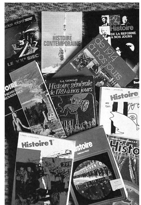
Quelques ouvrages analysés dans cette étude (cf. liste ci-dessus).