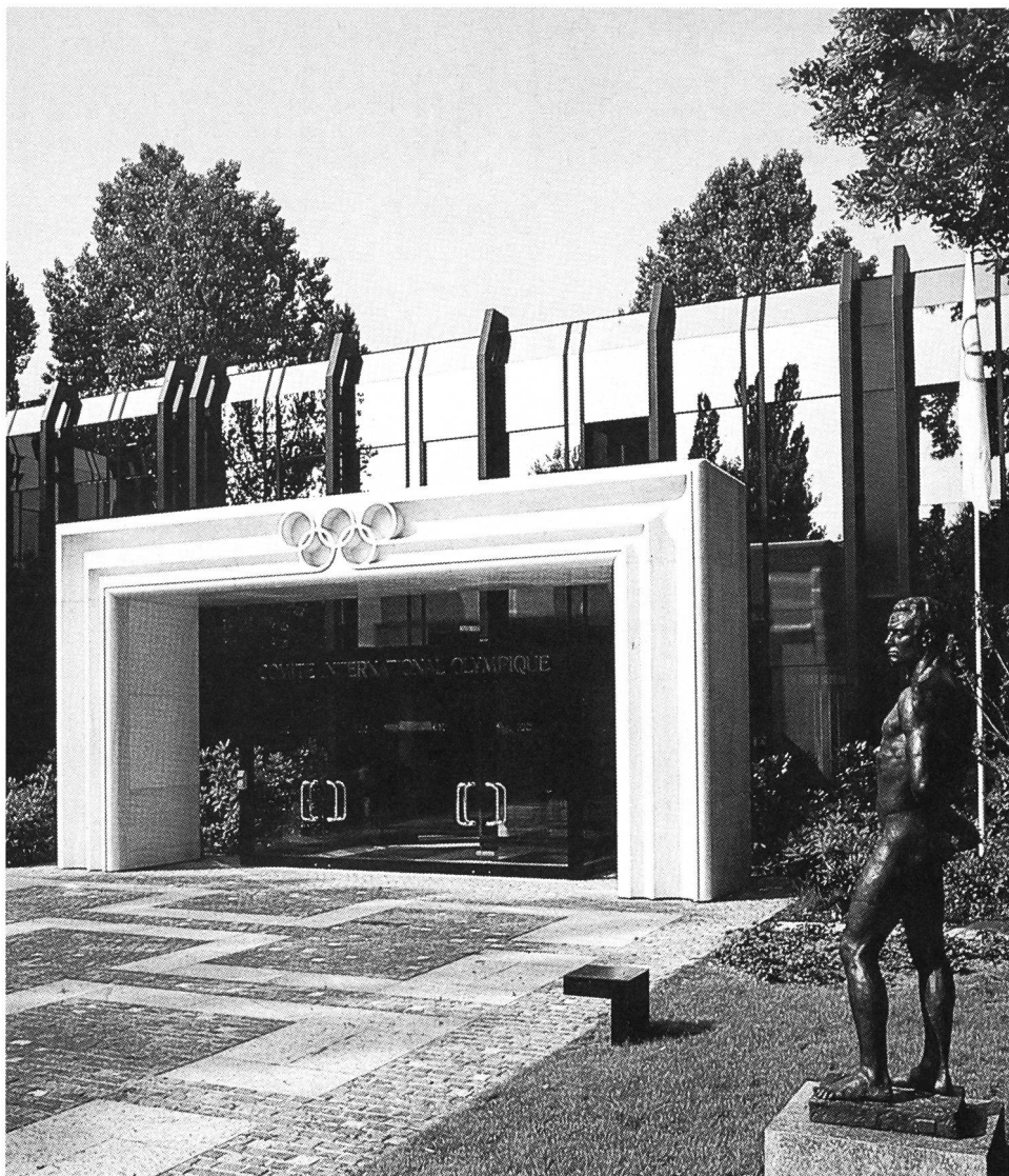
Maison olympique, à Vidy, siège du CIO, avec une statue telle qu'on en trouvera dans le Parc olympique d'Ouchy.

Le CIO a invité une vingtaine de firmes, entreprises et autres «corporations» de renommée mondiale à participer aux frais de construction par un don d'un million de dollars. En contrepartie, elles recevront le titre de «fondatrices et membres d'honneur à vie». Leurs noms, raisons sociales et sigles seront gravés sur un mur en marbre blanc érigé dans le hall d'entrée du Musée. ■