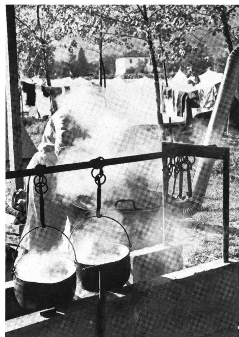
Tenero, c'est aussi cela.