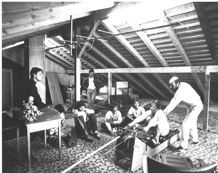
Travail ergométrique dans les combles aménagés en un local ad hoc.