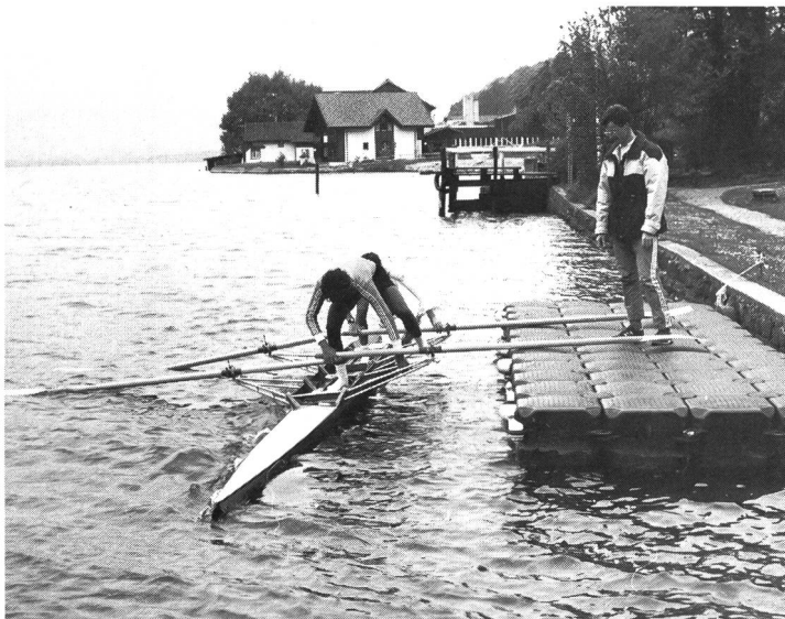
Embarcadère simple, mais fonctionnel.