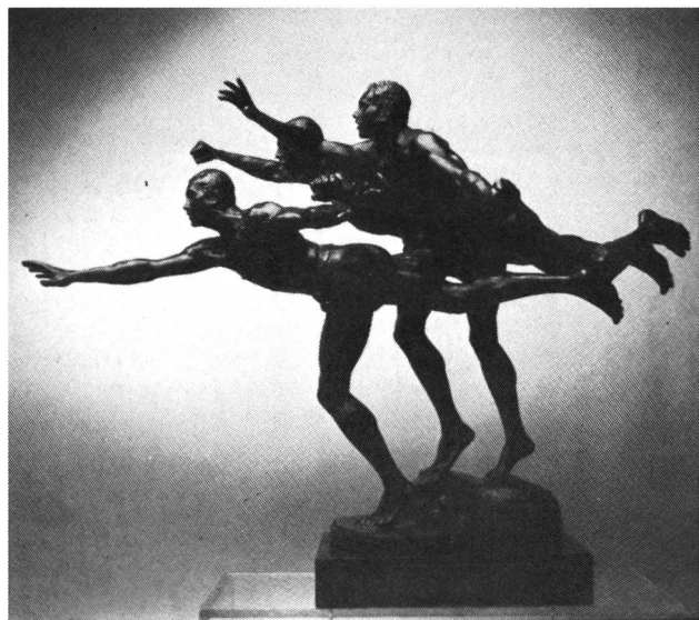
«AU BUT» (1880) bronze d'Alfred Boucher.

Livres (environ 8000); périodiques (plus de 800 titres, parmi lesquels MACOLIN figure en bonne place); manuscrits divers (lettres, textes originaux, etc.); archives sonores (en cours de constitution).