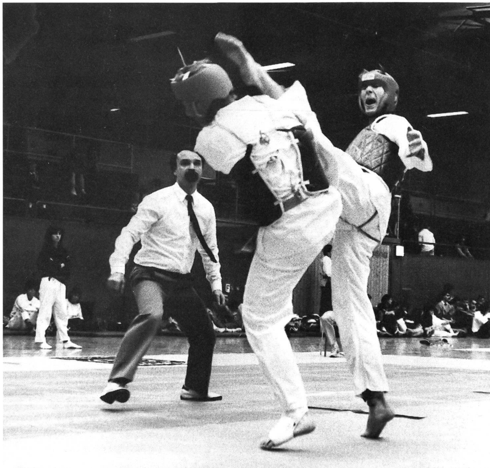
Mouvement typique: coup de pied retombant au visage.