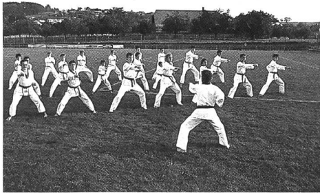
Une classe en action.