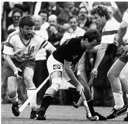
A bon terrain, bonne technique.

nifestations internationales. En décidant, en 1974, d'autoriser l'usage du gazon synthétique pour lesdites rencontres, la FIH a posé un jalon décisif pour l'évolution rapide qu'a connue le hockey sur terre durant ces dernières années. Depuis le «baptême du feu» (Jeux olympiques de Montréal, en 1976) la tendance en faveur du gazon synthétique s'est définitivement confirmée.