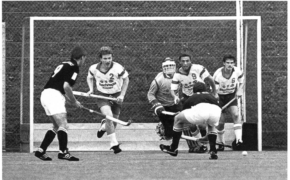
Corner court: technique et tactique à adapter.

accidents ou inégalités de terrain (gazon de longueurs différentes) n'existent plus. De même, les techniques étant simplifiées, il n'est plus guère possible de spéculer sur le hasard d'une balle non stoppée par l'adversaire;