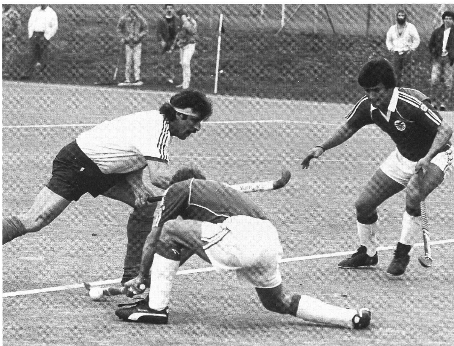
Contrôle par pose de la canne entière sur le sol.

Le recours au gazon synthétique est devenu vital pour le développement ultérieur du hockey sur terre. Les responsables suisses s'étant engagés dans cette voie, ils doivent désormais continuer à la suivre. Il ne faut pas, pour autant, qu'ils perdent les inconvénients de vue. Les milieux de l'industrie et de la recherche sont donc mis en demeure de rattraper, dans les meilleurs délais, le retard subi en raison du développement foudroyant du hockey sur gazon synthétique. On devrait en effet éviter que la technique du hockey sur terre continue de prendre le pas sur la technologie du gazon synthétique en tant que produit. ■