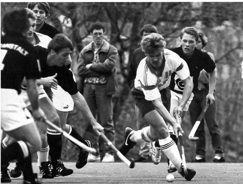
Revers opposé à un dégagement feinté.

De par la nature même du revêtement, on en est forcément arrivé, ces dernières années, à mettre au point toute une gamme de nouvelles techniques et de variantes. La pratique sur gazon synthétique a emprunté certains éléments au hockey en salle. Le lecteur trouvera ci-après, en résumé, la liste des principaux changements et innovations en matière de technique de base: