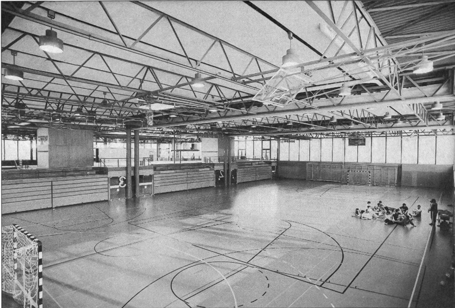
Comment s'y retrouver dans toutes ces lignes?

par les clubs est souvent très bas et, au niveau de l'école, il dépend essentiellement des penchants et des connaissances du maître d'éducation physique.