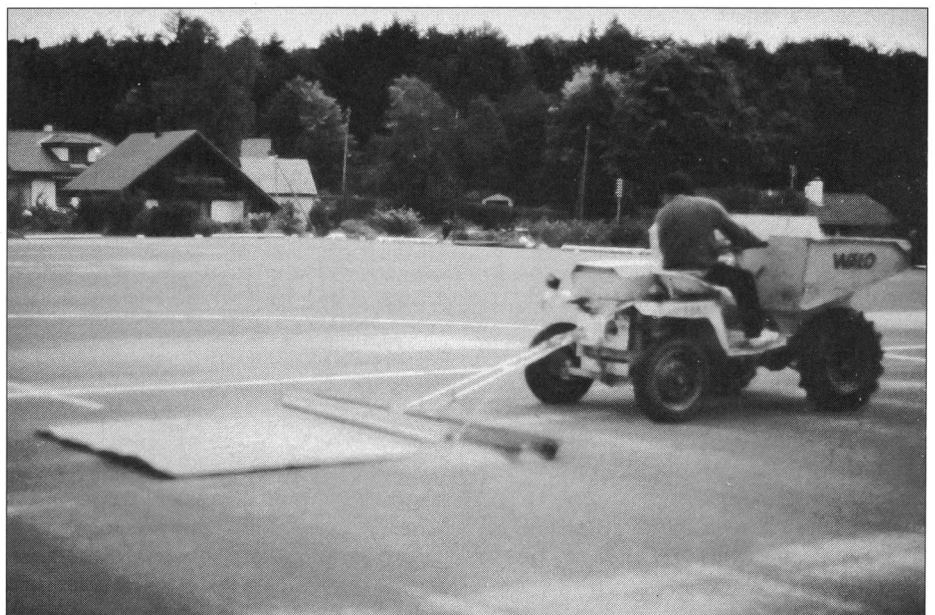
Gazon artificiel sablé de l'EFSM; il respecte l'environnement!