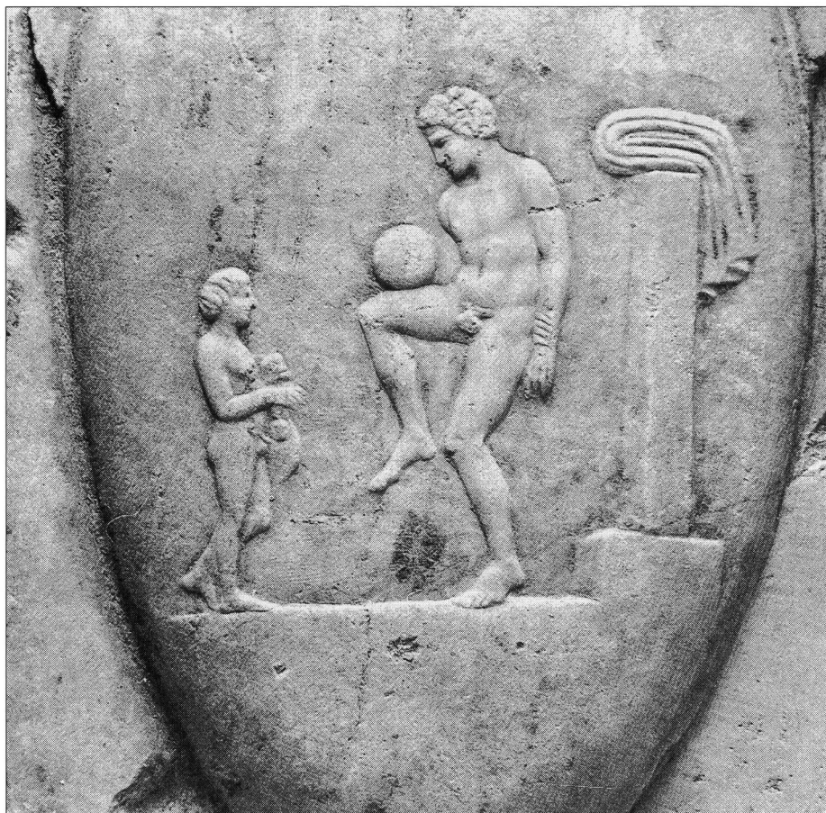
Cette stèle funéraire en marbre représente le premier joueur de football de l'histoire du sport, dit-on (Ive siècle avant J.-C.). Elle fait partie de l'exposition «Le Corps et l'Esprit» présentée par la Fondation de L'Hermitage à Lausanne (voir ci-contre).

Rien n'y fit: on jouait toujours et de plus en plus violemment. Dans le «Roi Lear», Shakespeare qualifie un de ses personnages de vil joueur de ballon , ce qui veut tout dire. La violence était telle qu'on pria dans les églises: ... Seigneur, éloignez de nous ce jeu. Qui est