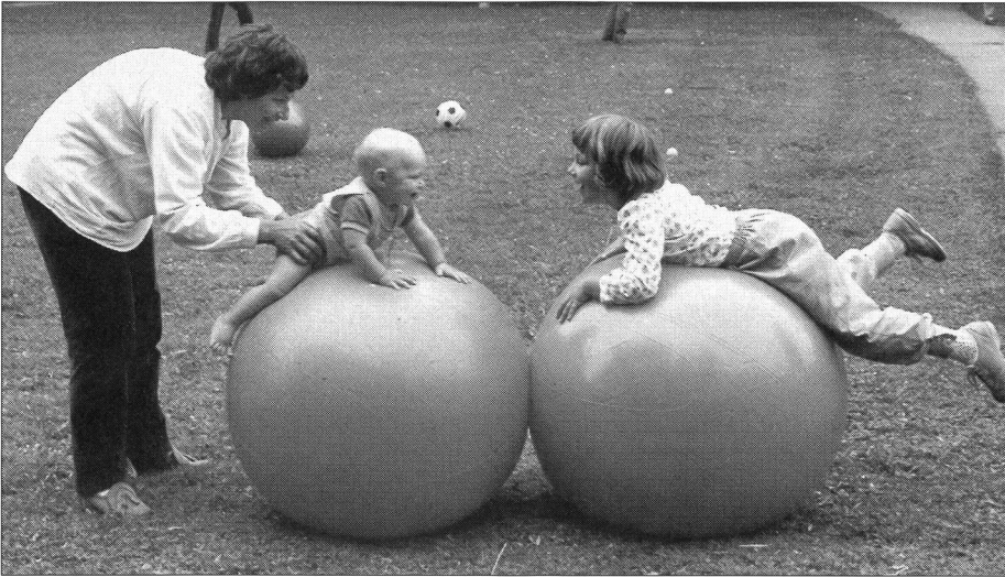
Le passage d'une génération à l'autre.

compagnait les parcours des skieurs iraniens ou libanais lors des derniers jeux olympiques. On leur reprochait d'avoir l'audace de prendre part à un concours dont ils risquaient de fausser les résultats en endommageant les pistes mises à leur disposition. Et cette colère avait quelques motifs. On ne pouvait se permettre de courir le moindre risque dans une compétition qui exigeait tant d'argent pour son organisation!