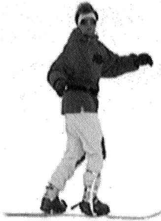
Préparation de la rotation avec le haut du corps, changement de carre direct