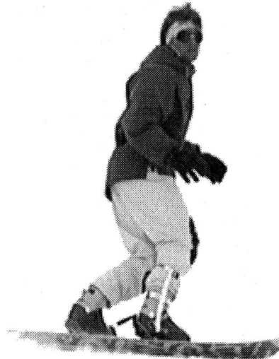
Préparation du prochain déclenchement