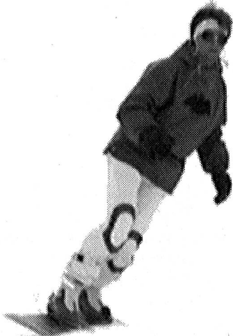
Bascule à l'intérieur du virage