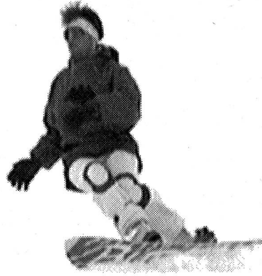
Conduite par flexion, préparation du prochain déclenchement