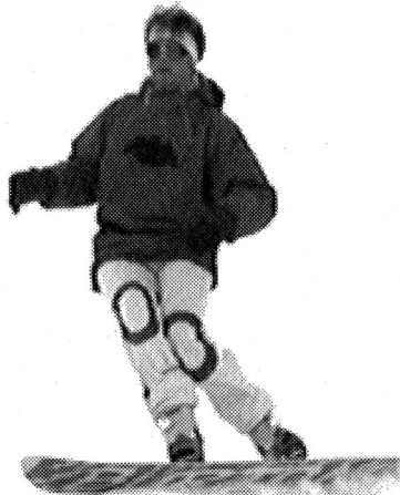
Déclenchement dynamique par extension, préparation de la rotation avec le haut du corps