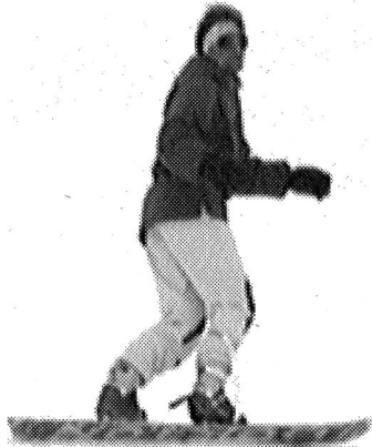
Déclenchement dynamique par extension