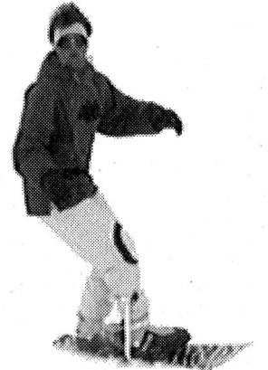
Bascule à l'intérieur du virage et rotation