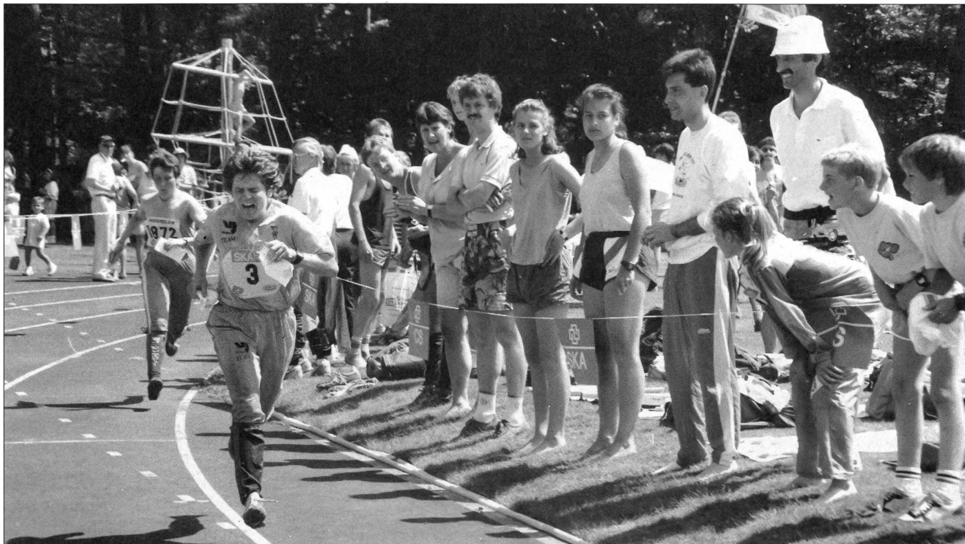
Les concurrents ont la ligne d'arrivée en vue, ligne tracée, ici, sur le stade de l'EPF de Zurich: la tension est grande chez les coureurs, mais les encouragements ne manquent pas!