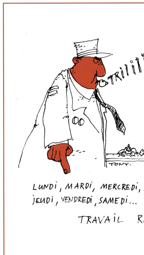
LUNDI, MARDI, MERCREDI, JEUDI, VENDREDI, SAMEDI...