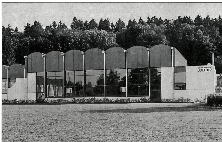
Centre sportif de l'Oiselier, à Porrentruy.