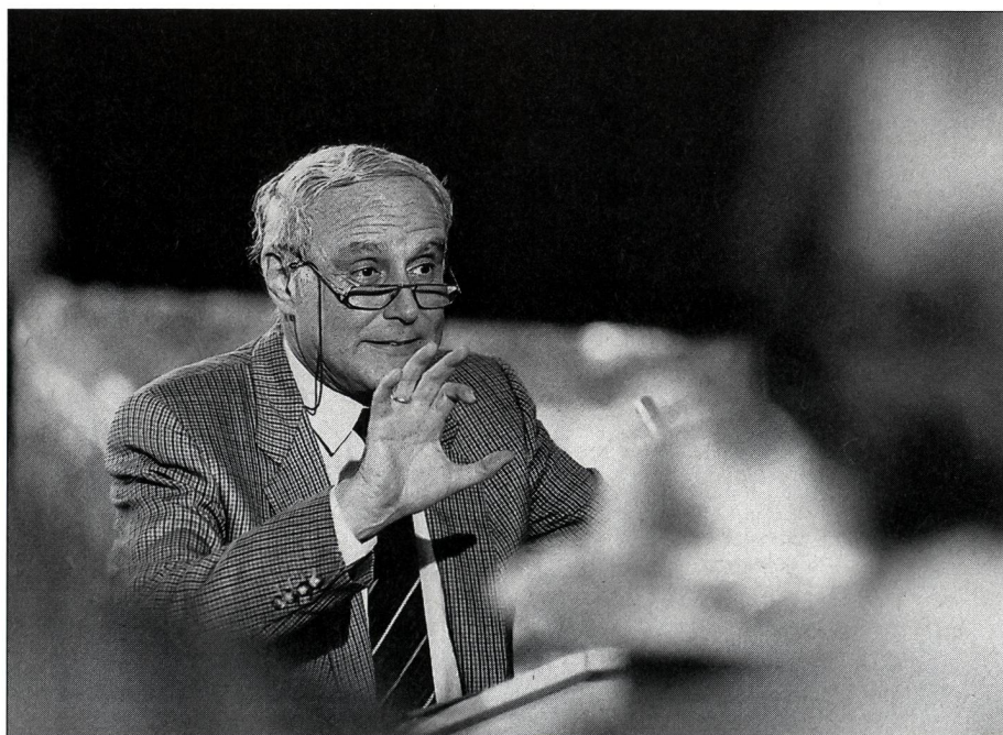
Flavio Cotti, ministre suisse de la culture et... du sport!

Désireux de ne pas trop disperser mon propos, je laisserai de côté le sport-spectacle, qui avait déjà depuis longtemps donné lieu à des diatribes de la part d'écrivains comme Georges Duhamel ou Jean Giono 2 . Je ne parlerai pas ici du spectateur, qu'un Georges Hébert voulait chasser du stade, car je suis soucieux de centrer cette réflexion sur les incidences culturelles du sport au point de vue du pratiquant, modeste ou de haut niveau.