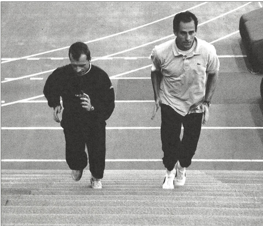
Montée d'escalier sous le contrôle du «physio».