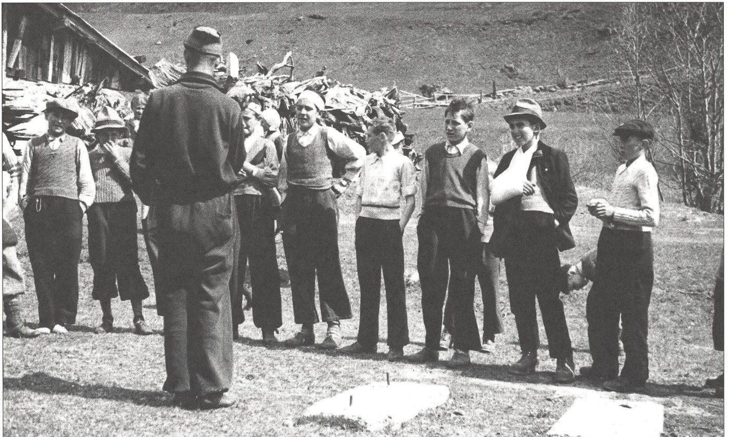
C'est du sérieux, les amis: courir, sauter, lancer... Ce pourrait être à St-Ursanne...

Dès cet instant, je ne me rendis plus compte de rien. Les événements me véhiculaient et c'est dans une inconscience presque totale que je me trouvai sur la ligne de départ de la «course d'endurance»: Jusque tout là-bas au fond, et re-