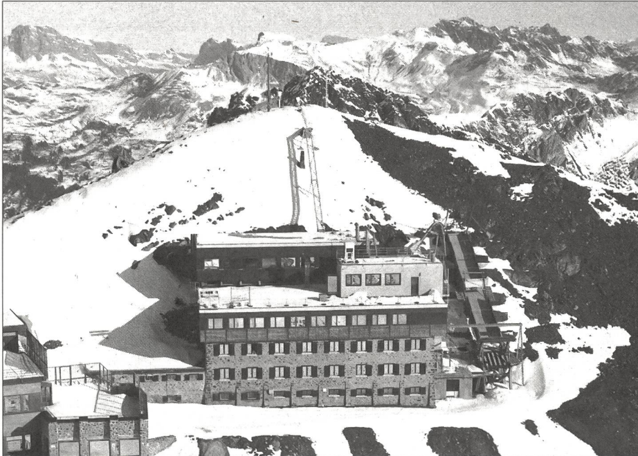
L'Institut de Weissfluhjoch/Davos à 2670 m d'altitude.

Quels sont les mobiles de cette harmonisation? Y a-t-il des modifications importantes? De quels moyens dispose-t-on dans le domaine de la prévention des avalanches? Le présent article vise à répondre brièvement à ces questions.