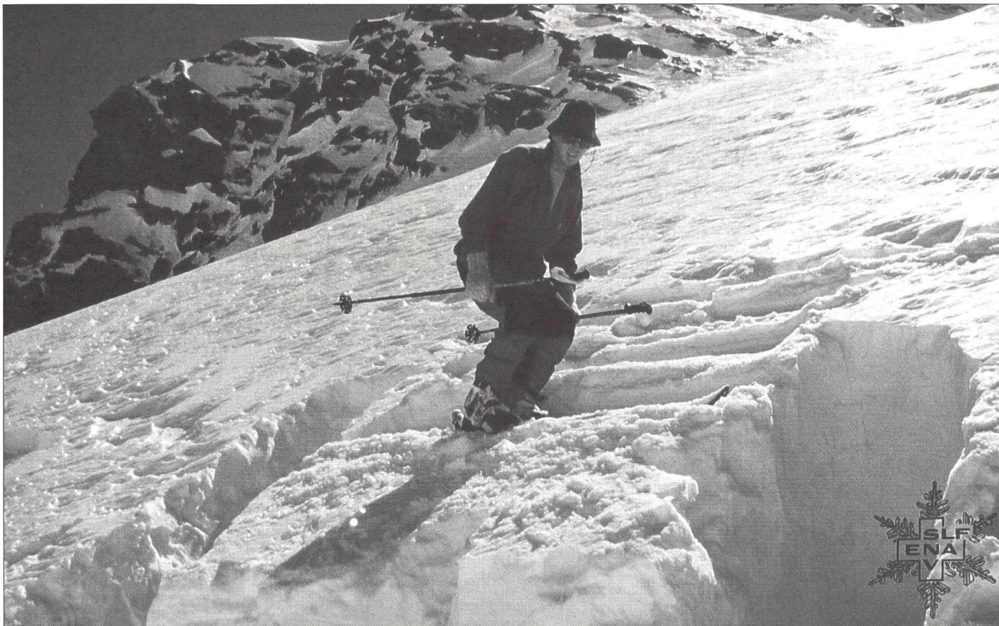
Divers tests effectués sur la pente permettent d'élargir utilement le champ des informations.