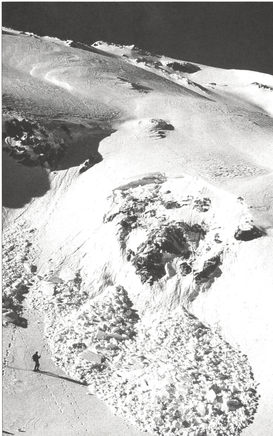
Amoncellement de petites plaques de neige: la cassure s'est faite très haut dans la pente!

Les formulaires complétés doivent être envoyés immédiatement après la randonnée à l'ENA, 7260 Weissfluhjoch/Davos.