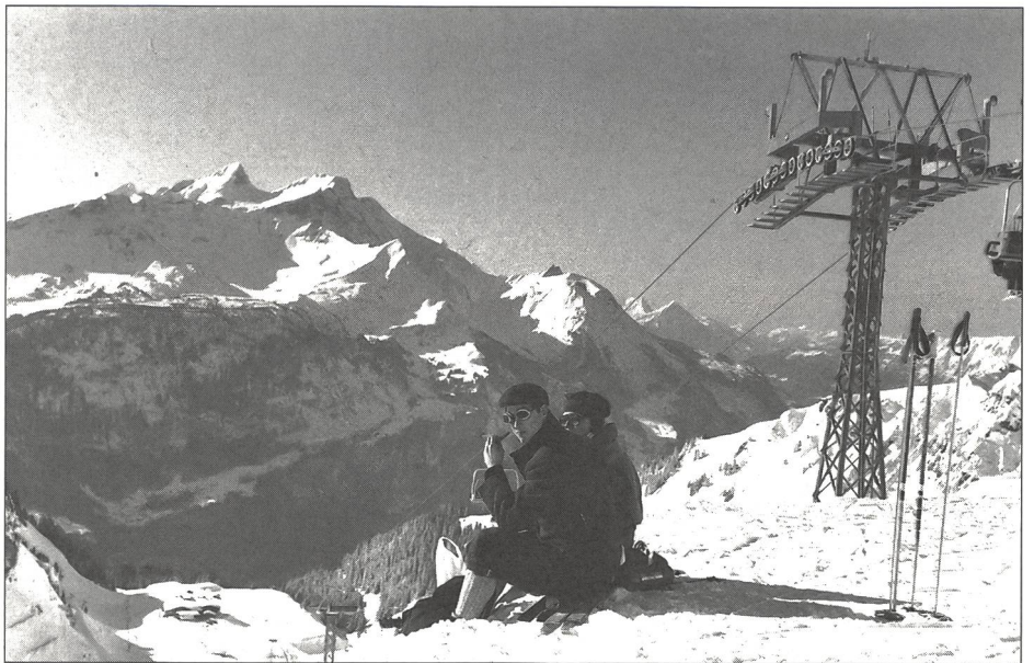
Des participants norvégiens en habits d'époque.

Du 27 mars au 2 avril, à La Clusaz (France) se disputeront les Championnats du monde style télémark.