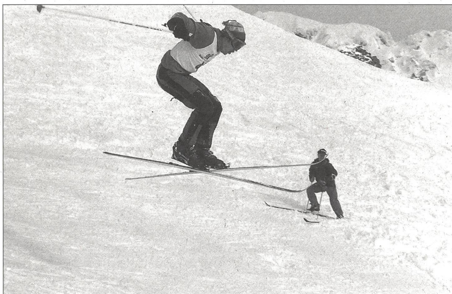
En saut, celui qui atterrit en zone dite «interdite» est pénalisé.

C'est dans un petit village norvégien du nom de Morgedal, situé à 250 km d'Oslo dans la province de Telemark, que prit forme la plus formidable épopée du ski. Né en 1825 dans une famille de paysans, Sondre Norheim mettait progressivement au point, vers les années 1860, une technique spécifique du virage et de la réception consécutive à un saut. Il l'appliqua pour la première fois avec succès lors d'une compétition à Iverslokken (actuelle ville d'Oslo), en 1868. L'élégance et l'assurance démontrées par Sondre fascinèrent littéralement ses adversaires tout comme le public.