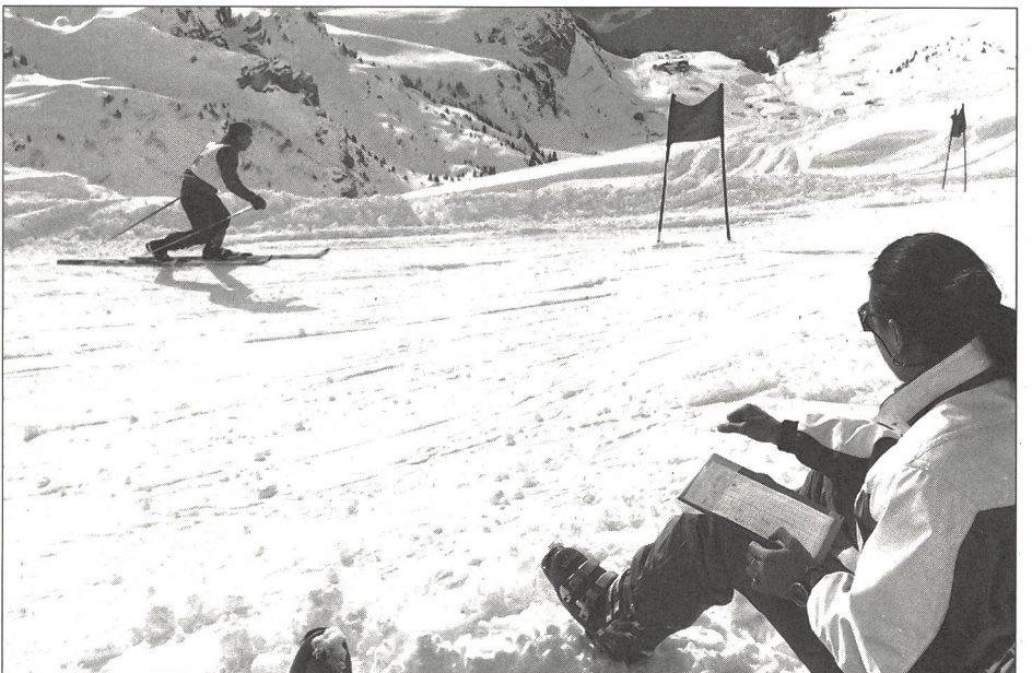
L'œil averti du juge contrôle le passage correct des portes dans le style télémark.