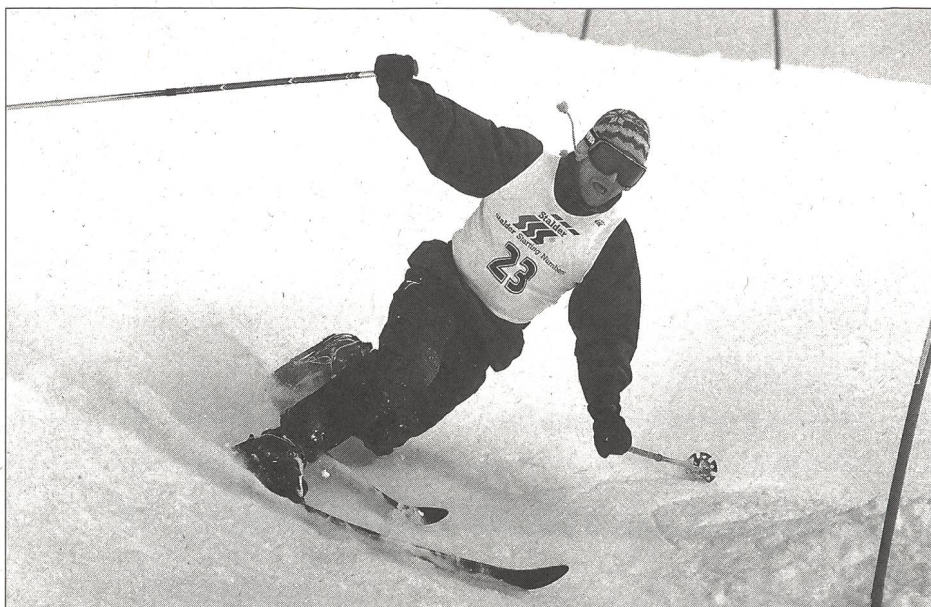
Lors de la «genuflexion», le talon de la chaussure du ski intérieur est visiblement décollé.

Alex Krattiger, maître de Adaptation française