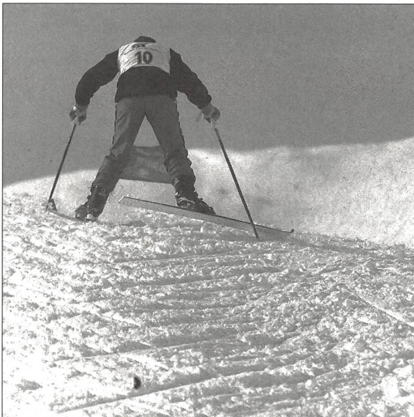
La montée en ciseaux coûte de l'énergie et coupe le rythme.