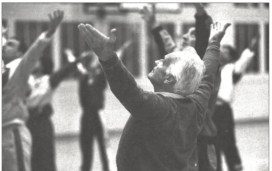
L'alternance entre tension et détente n'est plus garantie à notre époque.

Toutefois, l'importance du sport pour la relaxation au sens strict, c'est-à-dire comprise comme récupération en profondeur, réside dans la phase de récupération après l'activité sportive , l'effort physique entraînant un renforcement de l'activité du parasymphatique lors de la phase trophotrope. Certains types d'activité sportive, vus sous cet angle, sont particulièrement intéressants (Meusel 1992). Les expériences réalisées ont en