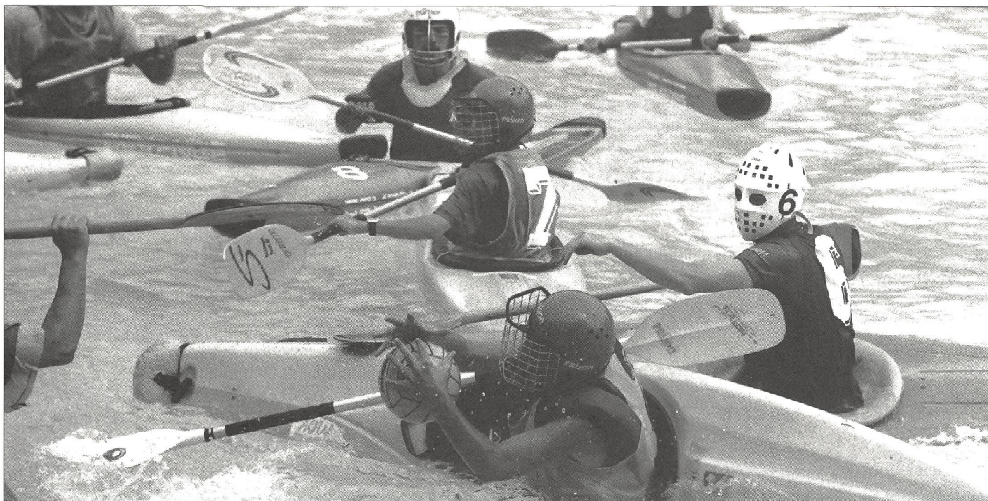
Les pagaies entrent dans la danse pour s'emparer du ballon ou repousser l'adversaire.

canoë-kayak sous toutes ses formes: les excursions en eau vive, les disciplines de compétition (slalom, régates, descente) et, également, le kayak-polo. Enfants et jeunes sont prêts à s'engager. Ils aiment se mesurer, adorent participer à des compétitions. Ballon et buts sont des éléments nouveaux en canoë-kayak. Le kayak-polo récompense de manière tangible l'engagement et la créativité des participants: sous la forme de buts!