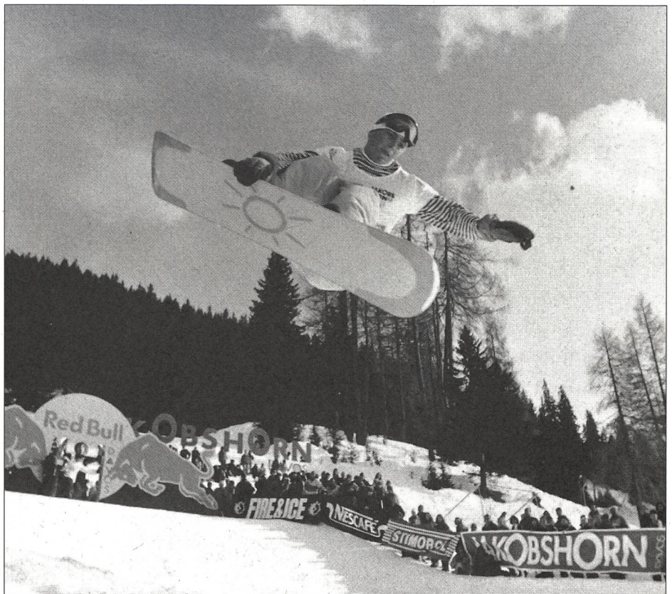
Concentration et élégance en «Pipe».

En dehors du sport, le snowboard est aussi un style de vie dans lequel la liberté a la part belle. Mais le comportement «Just for fun» est-il compatible avec la sanction du contrôle