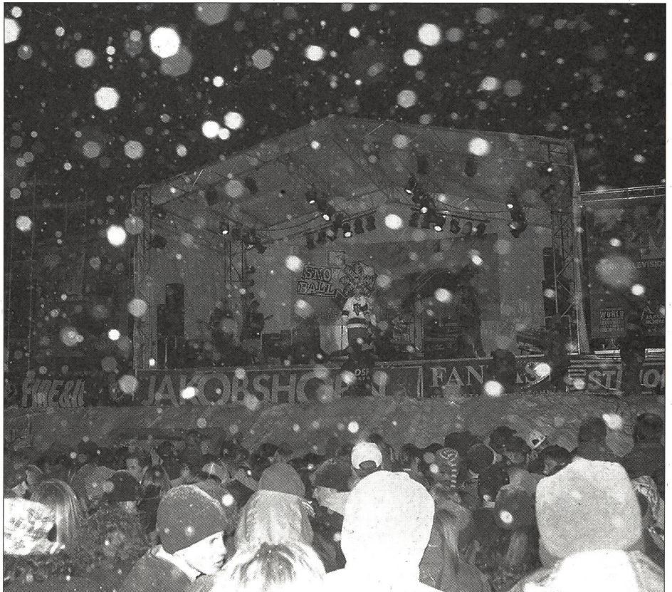
Hip-hop et snowboard font bon ménage. Le groupe «Dog eat Dog» en concert.