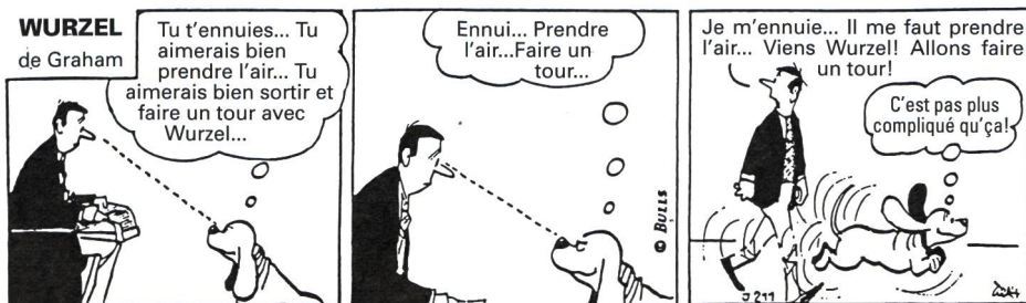
Hypnose ou simple suggestion?

sation, il est important d'établir d'abord si nous sommes bien en concordance avec lui. On y parviendra, entre autres, par le biais du langage non verbal, en reflétant ses gestes et ses attitudes selon le principe du miroir, et cela pendant quelques minutes. Puis nous modifierons notre comportement physique et attendrons sa réaction. Si cette dernière va dans le sens d'une identification à notre nouvelle attitude et à nos nouveaux gestes, c'est qu'une véritable relation non verbale s'est établie et nous pouvons faire nos propositions à notre vis-à-vis avec de bonnes chances qu'elles obtiennent son adhésion (Richardson, 1992). Par contre, si notre interlocuteur ne réagit pas à ce test de mise en connexion, c'est que nous ne sommes pas encore sur la même longueur d'onde et qu'il faut poursuivre le procédé du miroir en guise de préparation à la seconde étape dont il est question ici.