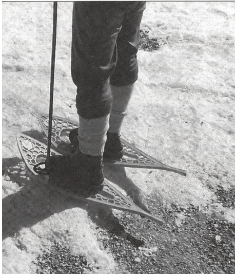
es raquettes à neige ont bien évolué!...