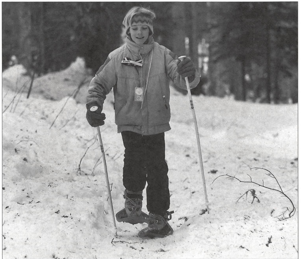
Comme Jack London dans le Grand Nord...

quettes à neige de Suisse, qui s'est été une véritable réussite aux dires