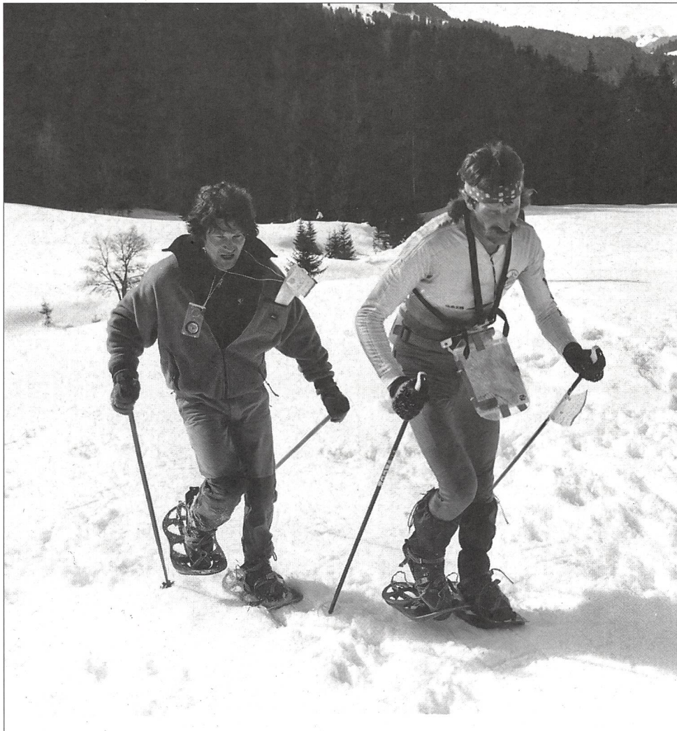
Les coureurs chevronnés apprécient le paysage valonné des Préalpes, terrain idéal pour la CO.