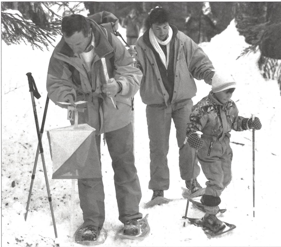
La CO en famille; il s'agit de prendre le chemin le plus court d'un poste à l'autre.