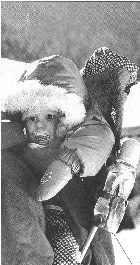
in et un papa poule: en avant pour l'aventure!