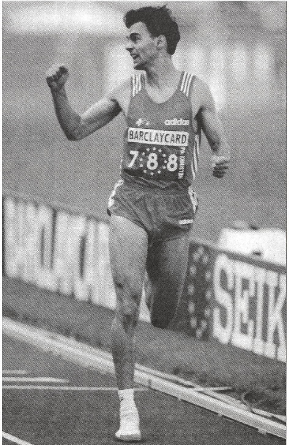
Helsinki, Championnats d'Europe 1994: médaille de bronze.