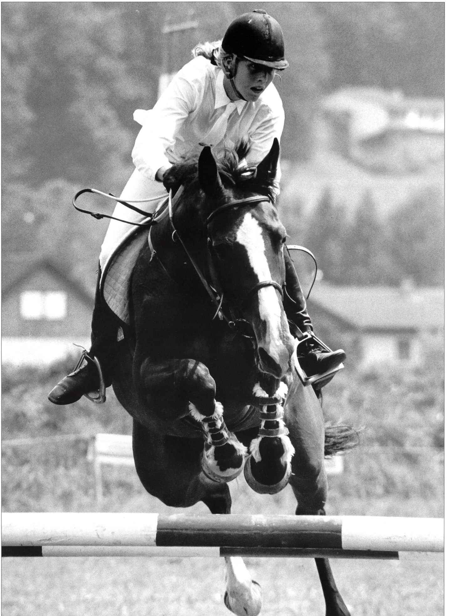
Les sports équestres, désormais au programme Jeunesse + Sport.