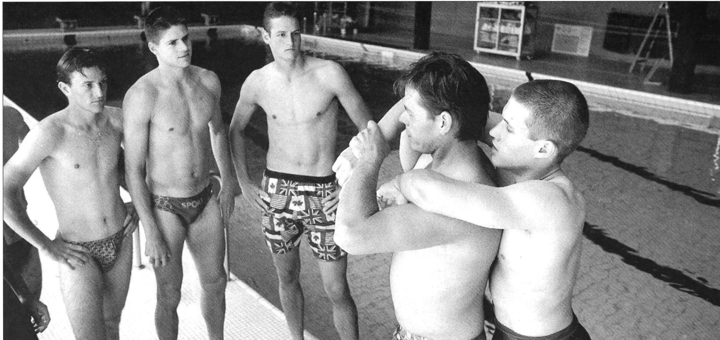
A la piscine de l'EFSM, les recrues reçoivent une formation de sauveteur.

Du 2 septembre au 11 octobre dernier, l'EFSM accueillait pour la dixième fois les cours technique de sport de l'Office fédéral des armes de combat (OFARC). Plus de 600 recrues ont déjà reçu la formation de «chef de sport 1», formation