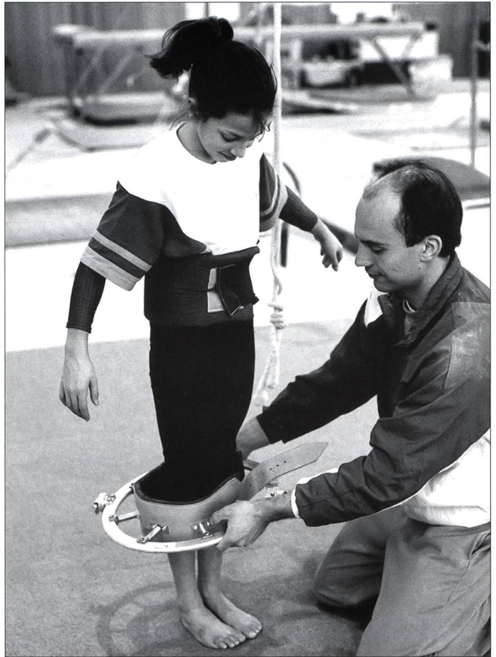
Un accessoire pour éviter de prendre des risques inutiles...