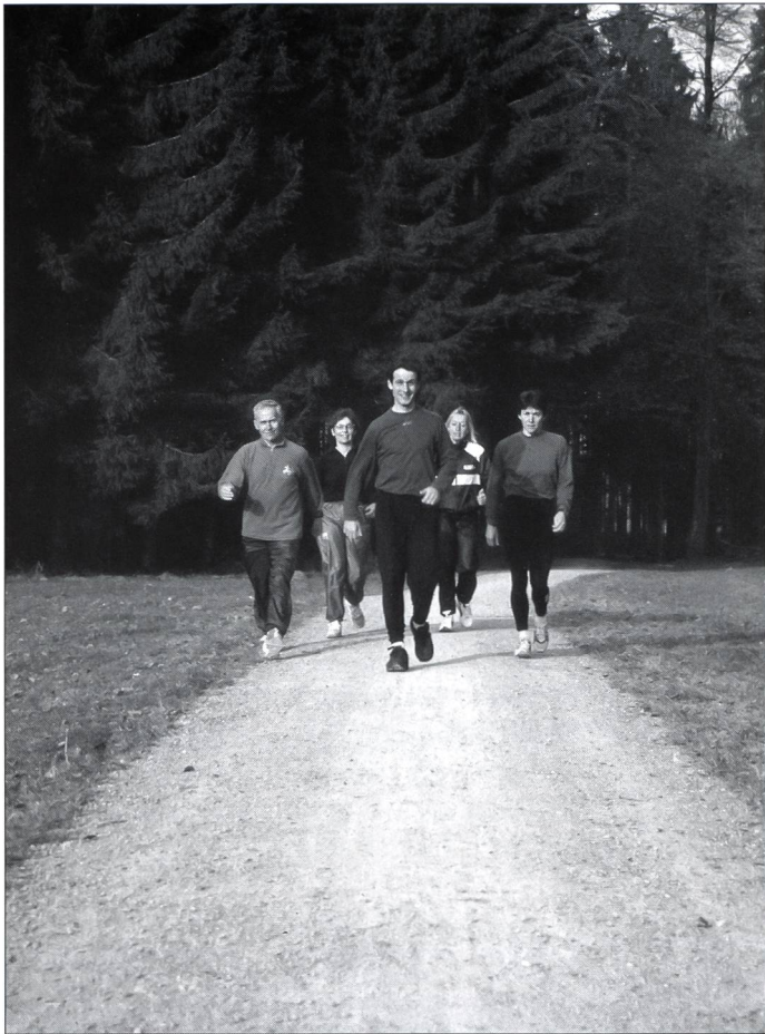
Le walking, c'est encore mieux que la marche sportive!